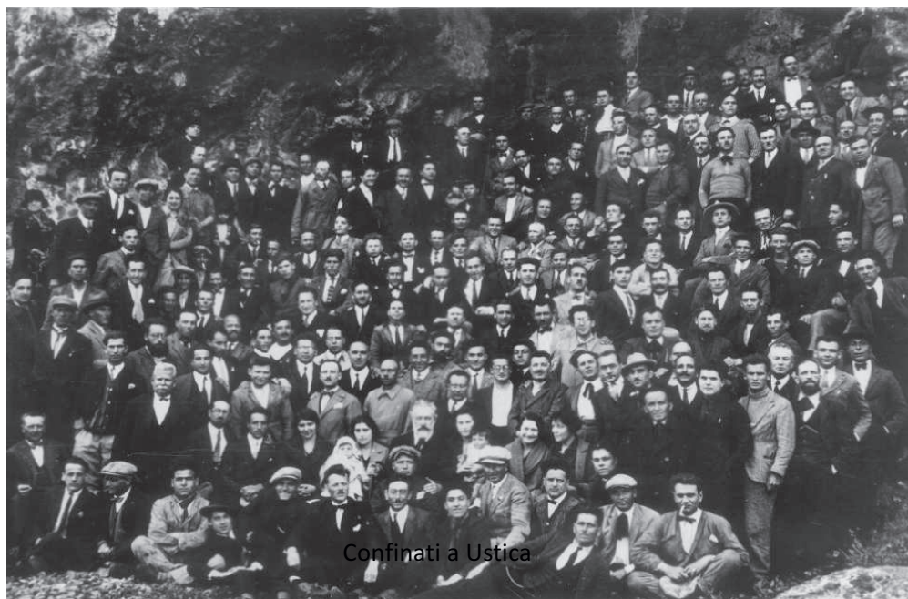
Confinati a Ustica

anarchiche col loro comportamento. Di proposito non ho parlato dei viventi, di quelli che, col loro sacrificio ieri e la loro azione oggi, sono riusciti veramente a dare un senso e continuità al movimento anarchico.