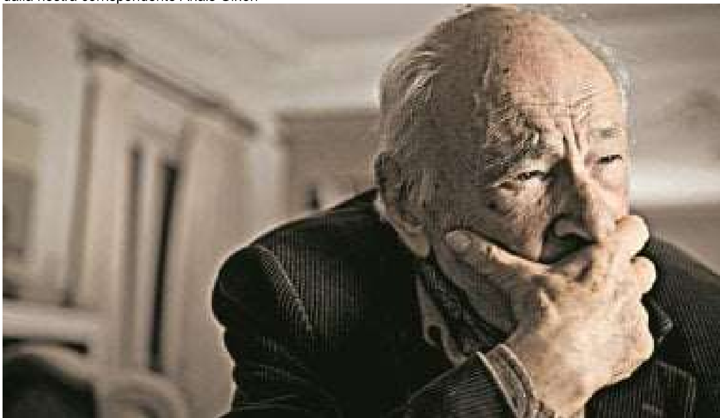
Il filosofo Edgar Morin